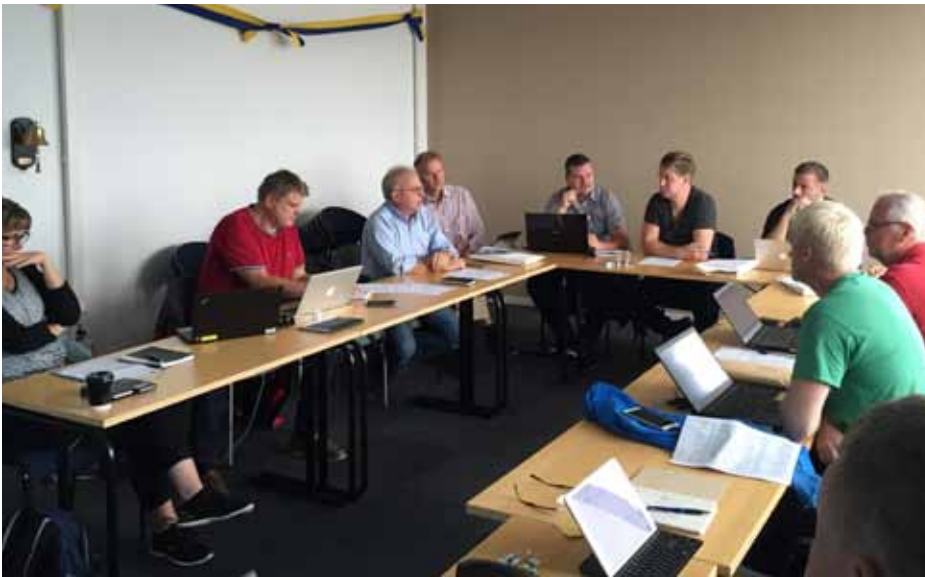
Kustrådet samlat till möte på den nya kuststationen i Gävle