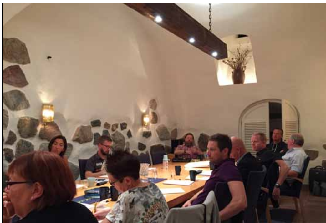
Tullrådet samlat till möte i sammanträdesrummet på Västerlånggatan i Stockholm

E fter uppehåll för semester och sommarledighet så är det fackliga arbetet i full gång igen och årets tredje ordinarie Tullråd hölls i TULL-KUST s lokaler på Västerlånggatan i Stockholm.