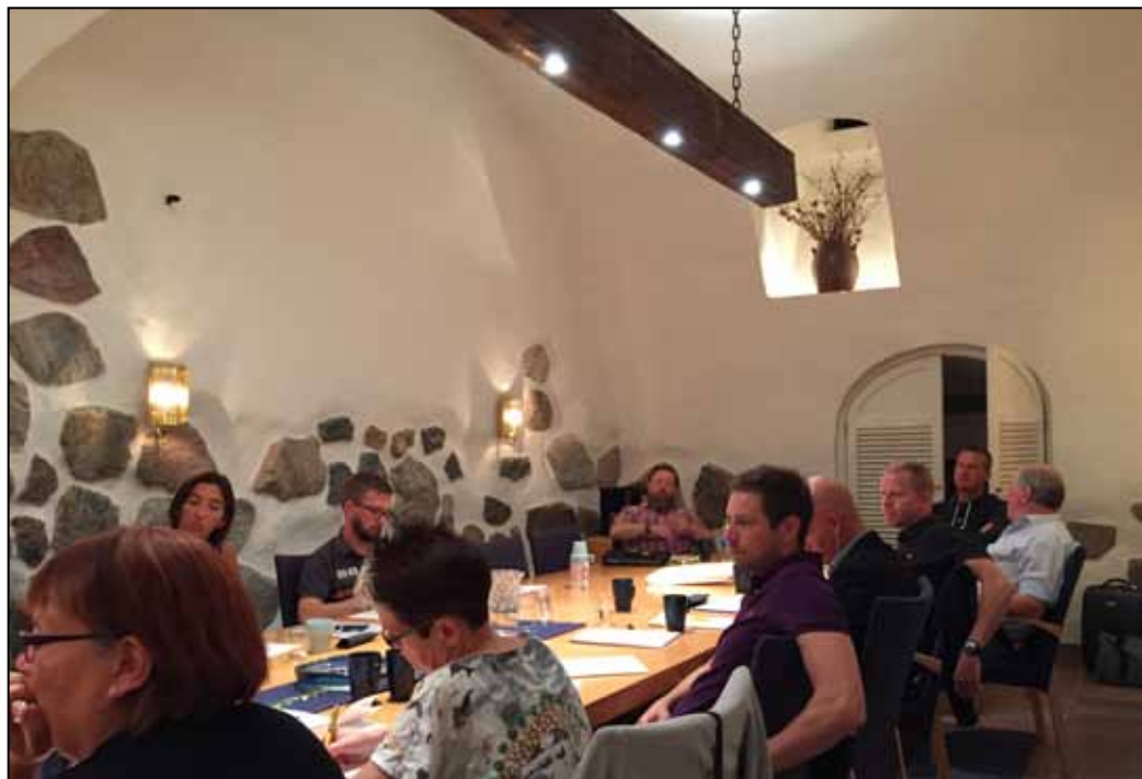
Tullrådet samlat till möte i sammanträdesrummet på Västerlånggatan i Stockholm