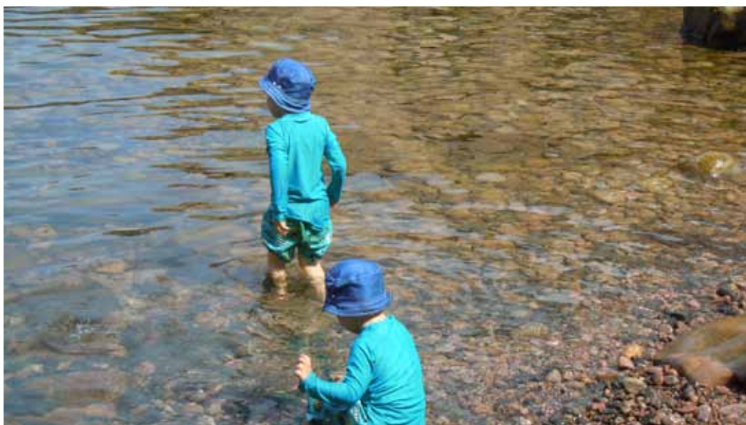
Vad är mer somrigt än barn vid sjön en varm sommardag