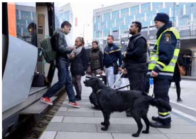
Patrull. På tågstation Hyllie för kontroll av tågagn.

Precis efter betalstationen Forts. på nästa uppslag