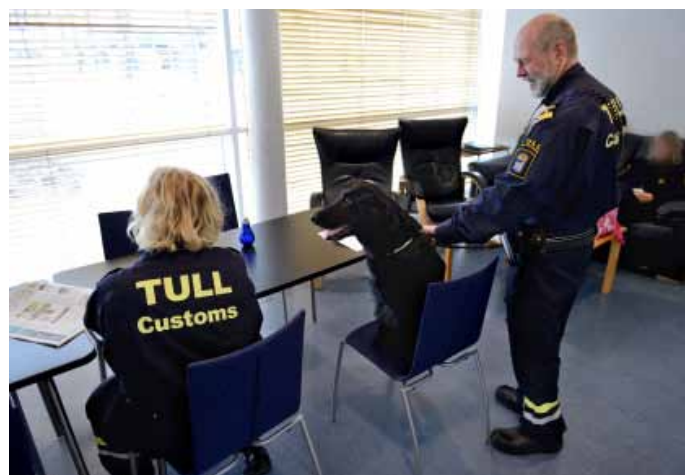
Tullstationen vid Öresundsbrofästet.