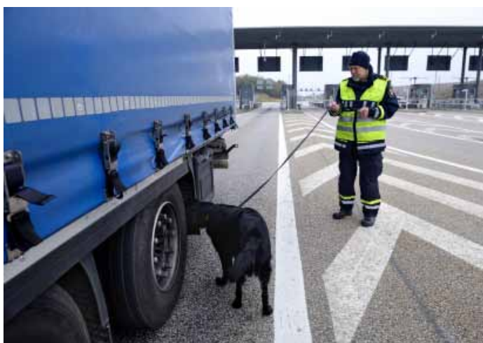
Hickas känsliga nos letar efter suspekta dofter men hittar inget anmärkningsvärt.