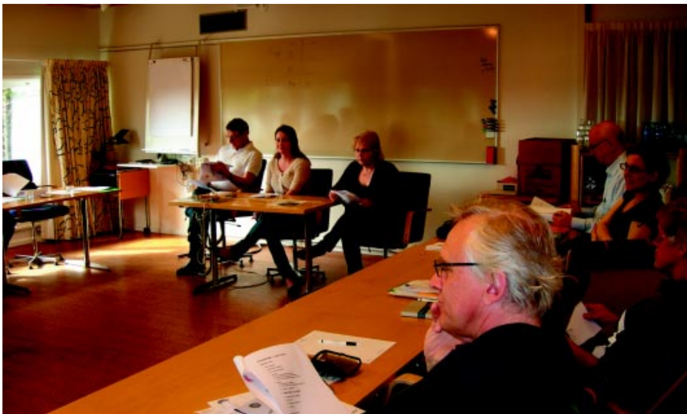
Grupparbete på kursen som hölls på Djurönäset utanför Stockholm