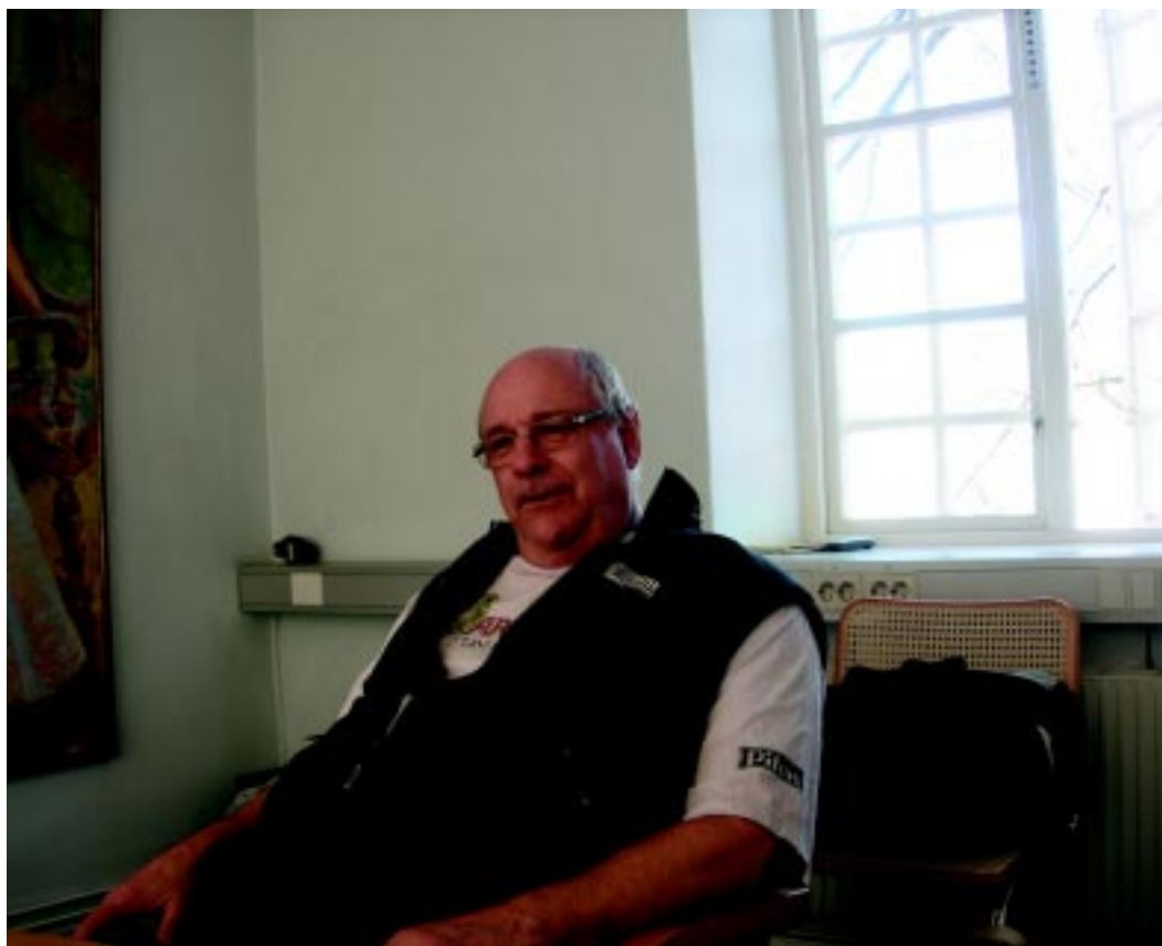
Text och Foto: Jan-Olof Jönsson

Är som vanligt på mot vår vackra huvudstad Stockholm. Det är en underbar vårmorgon och fåglarna håller full morgonkonsert i sin jakt på en partner. Solen lyser från en klarblå himmel och från sydväst kan man ana en svag morgonbris. Vårens dofter kittlar i näsan det är de vårliga ljuvliga dofterna som sakta sprider sig och inger hopp om en kommande sommar. Det är nu som allting börjar på nytt igen. Efter en ovanligt lång, kall och framför allt snörik vinter känns allt detta än bättre. Bra för några veckor sedan kändes allt detta påtagligt avlägset. Men som alltid så kommer det en vår med efterföljande sommar. Stockholm bjuder på samma underbara vårväder och det är