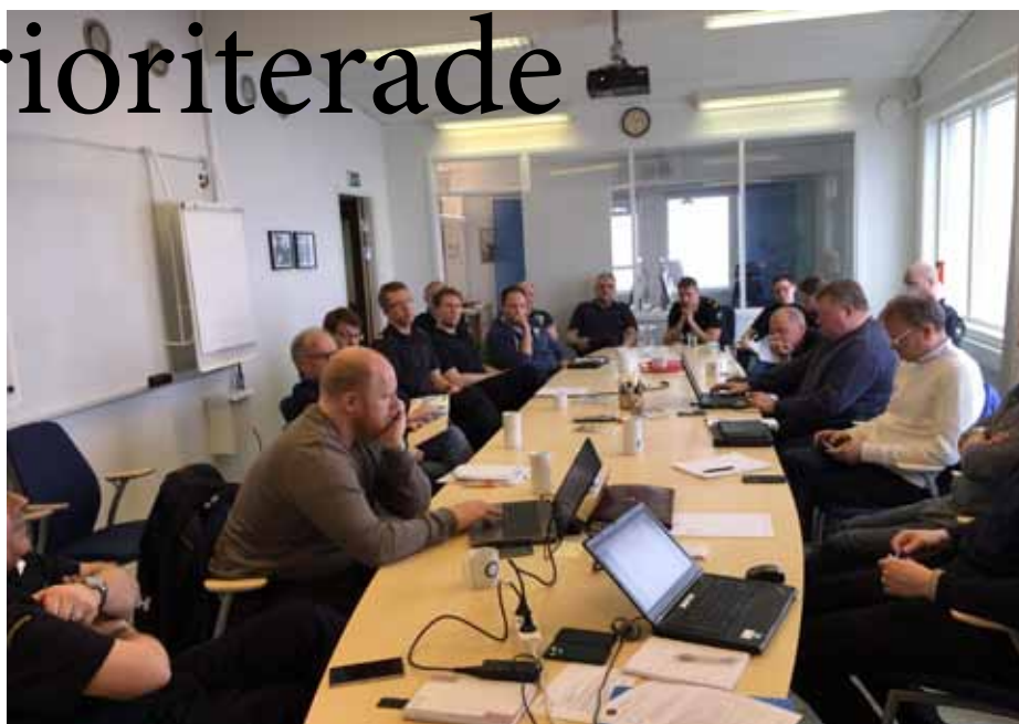
I samband med kustrådsmötet hölls ett medlemsmöte ipå Kuststation Umeå

medlemmarna och de givande diskussionerna.