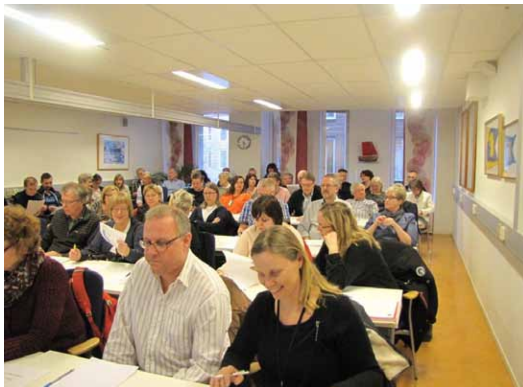
Ett sextiotal medlemmar samlades till årsmöte i avdelning Väst