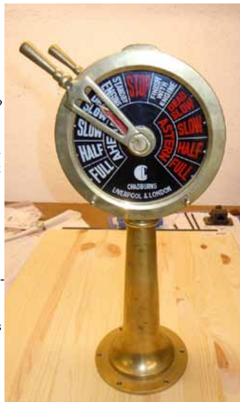
Maskintelegraf. Kanske tid att dra ner till "dead slow ahead".

Vad får då allt detta för konsekvenser? Jo framför allt kan det tydligt märkas att det