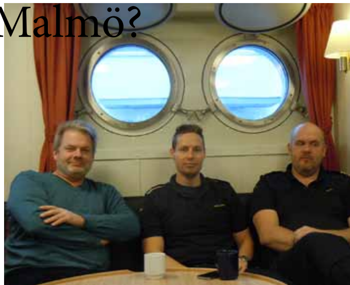
Tre förväntansfulla kustare ombord på KBV 034 Helsingborg

– Ja så är det tänkt men det märkliga nu är att i den referensgrupp som nu ska bildas ingår enbart personal från Ks Heg med motiveringen att det är Ks Heg som ska flytta. Vi tycker detta är märkligt och olyckligt förhållningssätt och innebär att vi-känslan för den tänkta ”Skånestationen”, som vi känner idag riskerar att komma i bakvatten. Vi tycker detta är helt fel väg att