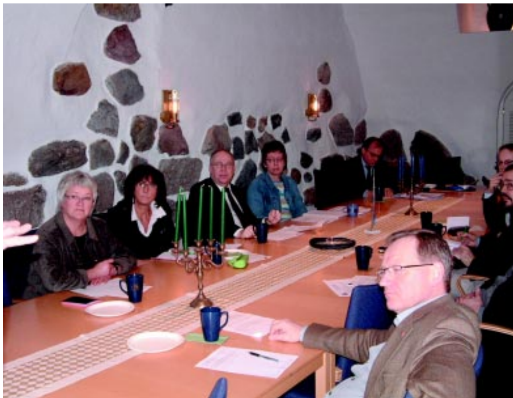
Socialdemokraternas ledamöter i skatteutskottet besökte TULL-KUST:s kansli

Vid sittande bord fick TULL-KUST förhandsinformation om ett Utskottsinitiativ (RO 3:7) som socialdemokraterna i Skatteutskottet kommer att offentliggöra under dagen. I denna skrift yrkar de att Skatteutskottet tar initiativ till ett betänkande med ett tillkännagivande till Regeringen om medel i tilläggsbudgeten så att Tullverket kan fullfölja sitt uppdrag att kontrollera varuflödet, säkerställa